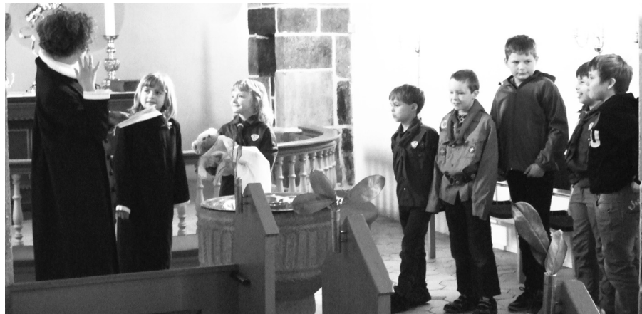
Palmesøndag, hvor spejderne medvirkede.

Der bliver sunget, leget, fortalt historier, lavet knob ect.